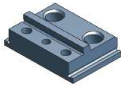
Führungsplatte BK 4014