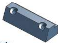
Führungsleiste BK 4018